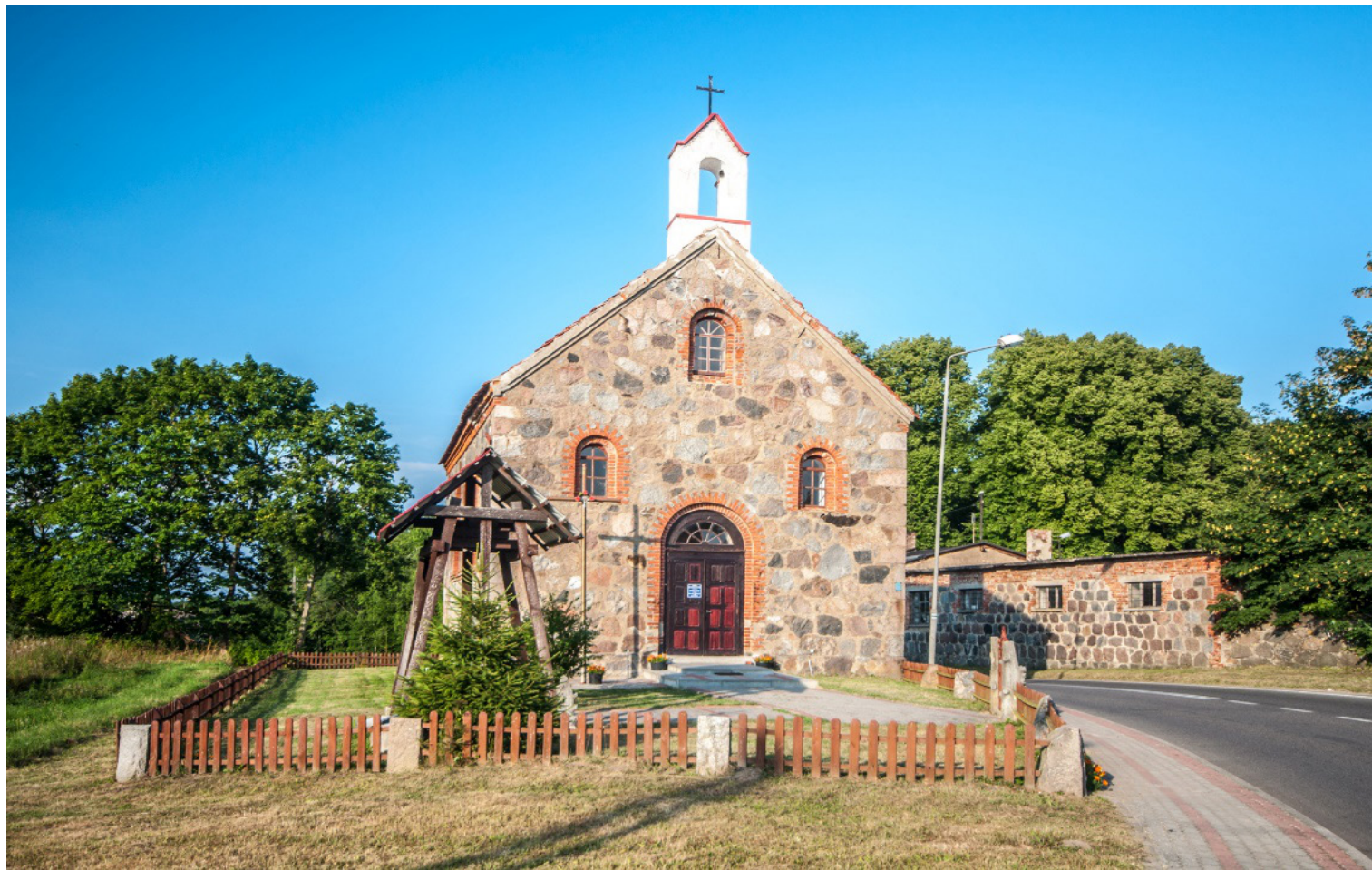
[ Kościół we wsi Borne ]