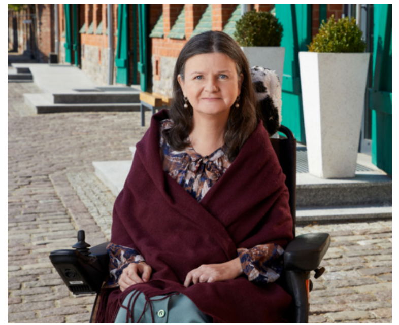
Fot. Barbara Leszczyńska, Krzysztof Jerszyński

[Małgorzata Muszyńska Biuro prasowe Urzędu Marszałkowskiego Województwa Zachodniopomorskiego w Szczecinie] źródło: www.wzp.pl