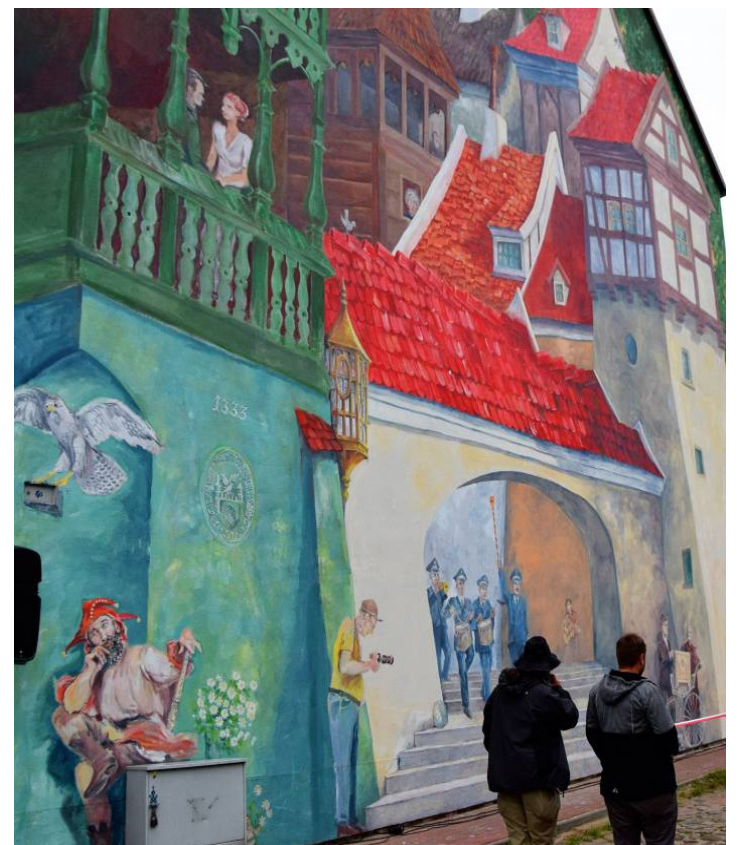
Mural można podziwiać na złocienieckim deptaku, przy ul. Piłsudskiego 16