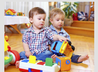
Co słychać w złocienieckim żłobku