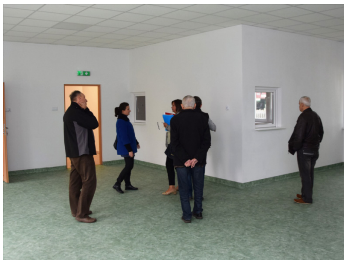
fot. Odbiór żłobka w Złocieniu