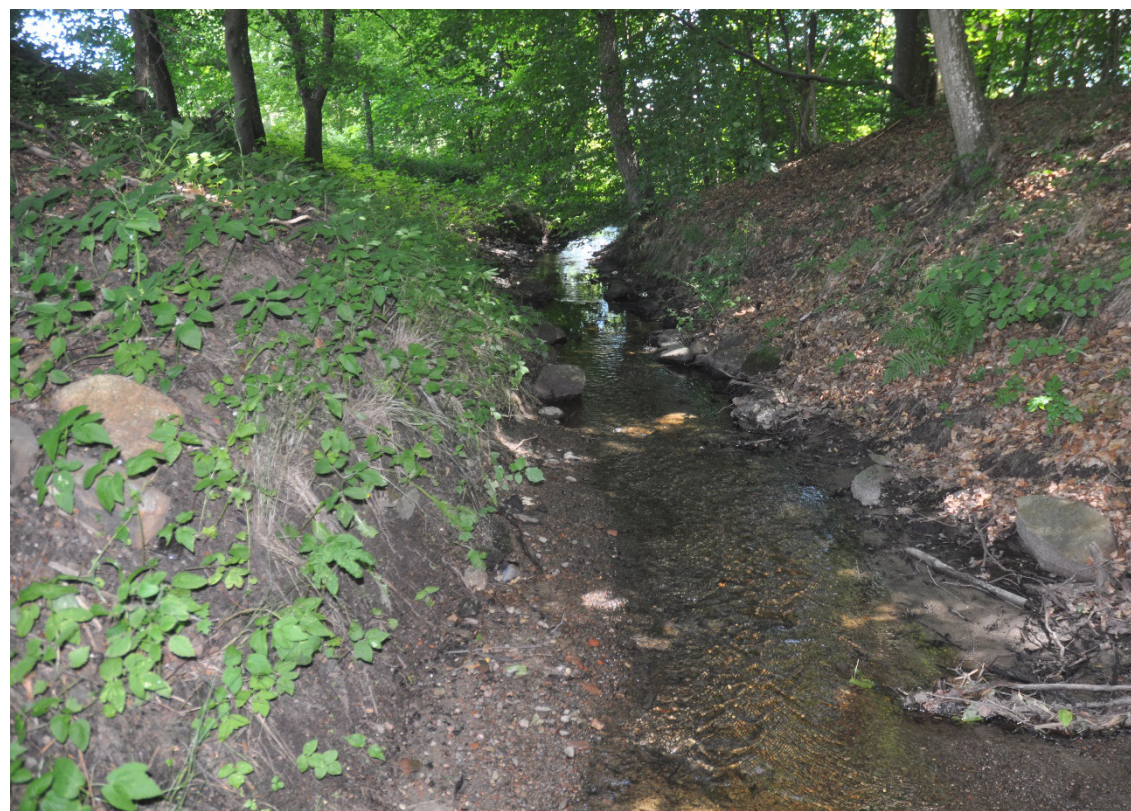
[ Strumień Borne ]

Zmęczony niedawno zakończoną walką chrześcijański rycerz zeskoczył z konia i zbliżył się do źródła, żeby napić konia i zaspokoić pragnienie. Nie zauważył nawet, że właśnie nadciąga niewielki oddział Mameluków. Dopiero przeraźliwy okrzyk arabskiej kobiety: „Kreuz wende dich von dem Borne!” pozwolił mu przygotować się na atak i skutecznie go odeprzeć. W powyższej wersji legendy Borne było synonimem słowa Brunnen, czyli źródła z wodą. Legenda ta znana jest też w bardziej rozbudowanej wersji, w której protoplasta rodu był giermkim cesarza Barbarossy: Działo się to podczas III wyprawy krzyżowej zorganizowanej przez cesarza Fryderyka I Bar-