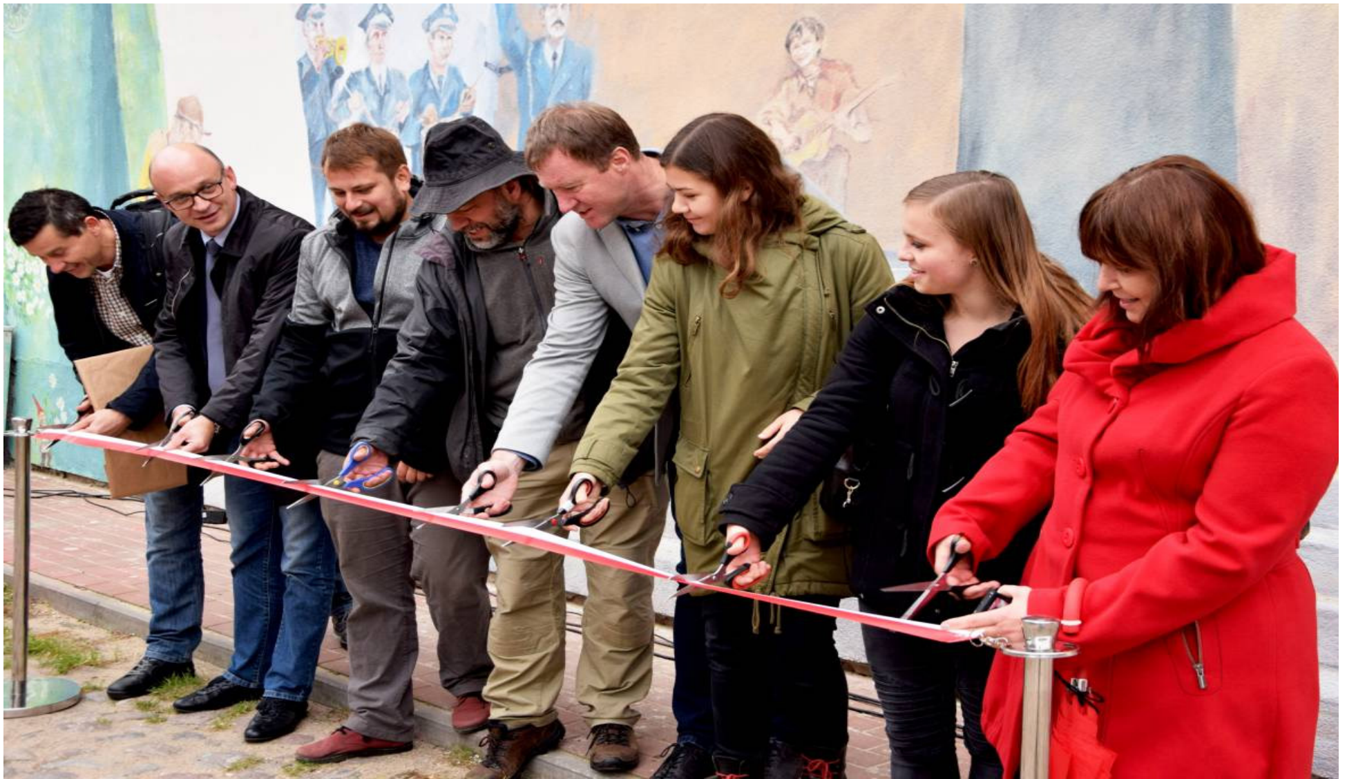
Przecięcie wstęgi przed Złocienieckim Murałem