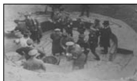
Moment wmurowania kapsuły w fundamentach wieży ciśnieniomierzem

wej części Bawarii, nad doliną Iller, powstał drugi ośrodek NS-Sonthofen. Trzeci to Ordensburg am Krössinsee – Złocienka. Ordensburgi miały służyć indoktrynacji młodzieży w duchu narodowo socjalistycznym. Budowę tego typu obiektów finansował początkowo Niemiecki Front Pracy (DAF). Budowę ośrodka nad Krössinsee rozpoczęto od uroczystego złożenia kamienia węgielnego w dniu 22 kwietnia 1934 roku. Podczas uroczystości, w fundamentach okrągłej wieży ciśnieniomierzem umieszczono miedziany cylinder będący swojego rodzaju „kapsułą czasu”.