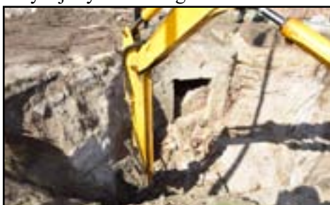
Rozpoczęcie prac wykopaliskowych

Początkowo pracowaliśmy na podstawie teorii „cienia”, widocznego na zdjęciach wykonanych w