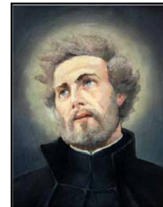
św. Andrzej Bobola