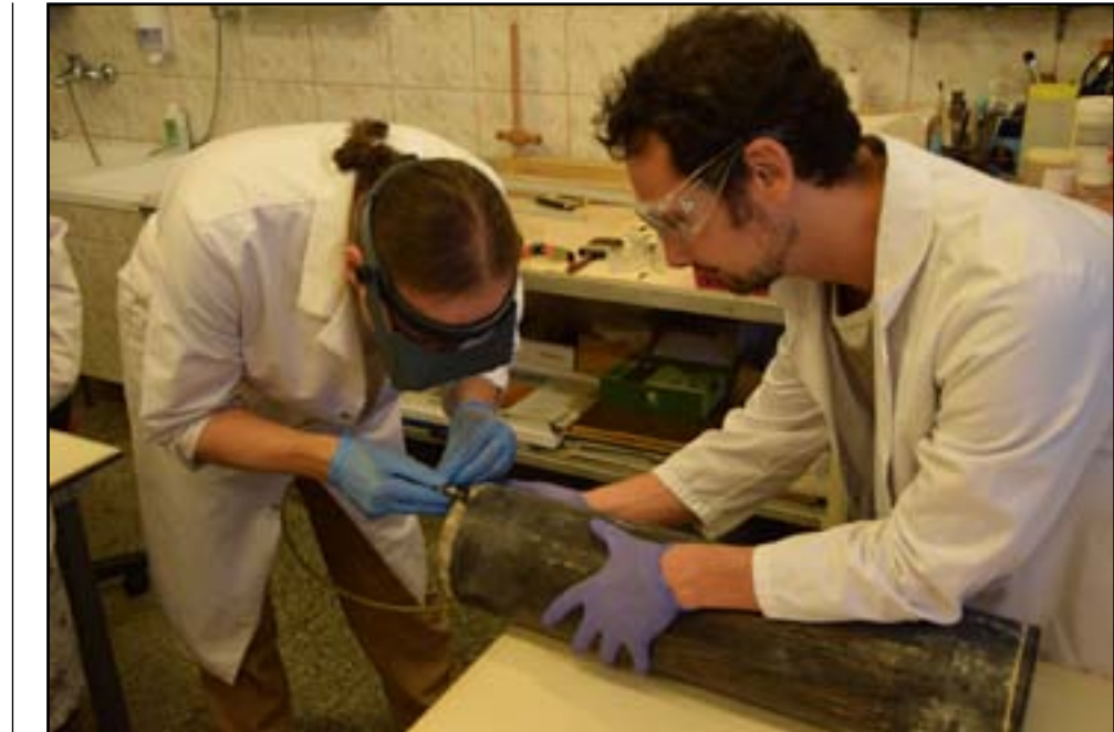
Specjaliści z MN w Szczecinie w trakcie otwierania kapsuły