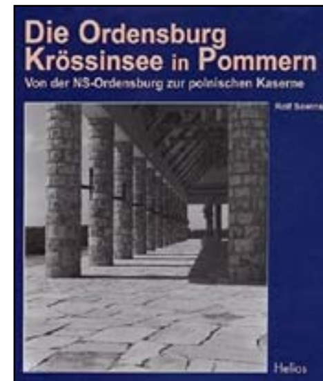
Książka Rolfa Sawińskiego - Tu po raz pierwszy pojawiła się informacja o kapsule czasu

Dzień 6 września 2016r. okazał się finałem. Po całkowitym odkryciu fundamentów wieży i skuciu warstwy przylegających do niego cegieł, o godzinie 17:45 zauważyliśmy granitową płytę, którą przykryto otwór wieńczący kapsułę! Padły słowa „MAMY TO”, ale przed nami jeszcze daleka droga przez beton, solidny beton... Po pewnym czasie młot uderowy przebił się przez ścianę i „wpadł” w pustkę... Po włożeniu dłoni w szczelinę można było wyczuć wieko metalowej kapsuły. Emocje sięgały zenitu. Po chwili „kucia” można było już zauważyć granitowy krążek, pod granitową płytą zakrywającą otwór kryjący kapsułę.