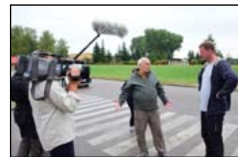
Wizyta ekipy programu „Było nie minęło” na miejscu wykopaliska

Od tej pory zaczęliśmy pracować delikatnie, ale z dużą dawką adrenaliny, która dodawała nam sił. Wystarowała piła tarczowa, którą ponacinaliśmy fundament wzdłuż i wszerz. To ułatwiło kucie bardzo twardego betonu. Po trzech godzinach ciężkiej pracy dotarliśmy do celu, trzeba było kuć do samego „dna”, ponieważ kapsuła była wklejona pionowo na zaprawie betonowej. Nie mogliśmy dopuścić do tego, aby podczas wyjmowania została ona wyrwana. Groziłoby to jej otwarciem, które mogłoby spowodować uszkodzenie materiałów w niej zawartych. Dnia 8 września 2016 r. zakopaliśmy ogromnych rozmiarów wykop. Wspomniane wejście do piwnicy zostało zakryte grubą stalową blachą, a w miejscu znalezienia kapsuły w trakcie zasypywania, umieściliśmy długą rurę, aby już wkrótce zostawić w niej złocieniecką kapsułę czasu... po jej złożeniu rura zostanie wyciągnięta, a otwór zakopany. Dnia 13 września 2016 r. o godz. 7:30 wyjechaliśmy do Muzeum Narodowego w Szczecinie, w celu otwarcia tajemniczej „kapsuły czasu” (złożonej pod budowę Ordensburga nad Krössinsee koło Złocienka) Przedmioty zamknięte w środku po raz pierwszy po 82 latach ujrzają światło dzienne. Z tuby wyjęto akt erekcyjny (napisany odręcznie na „pergaminie