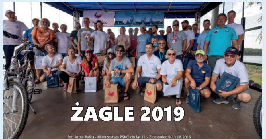
Mistrzostwa PSKO do lat 11 - Złocieniec 9-11.08.2019

W dniach 09 - 11 sierpnia 2019 r. na jeziorze Siecino odbyły się Regaty „Żagle 2019” XIV Mistrzostwa Polskiego Stowarzyszenia Klasy Optymist do lat 11; Mistrzostwa Polskiej Floty Klasy ISA 407 Puchar Starosty Drawskiego w klasie ISA 407 do lat 18, ISA 407 Senior OPEN.