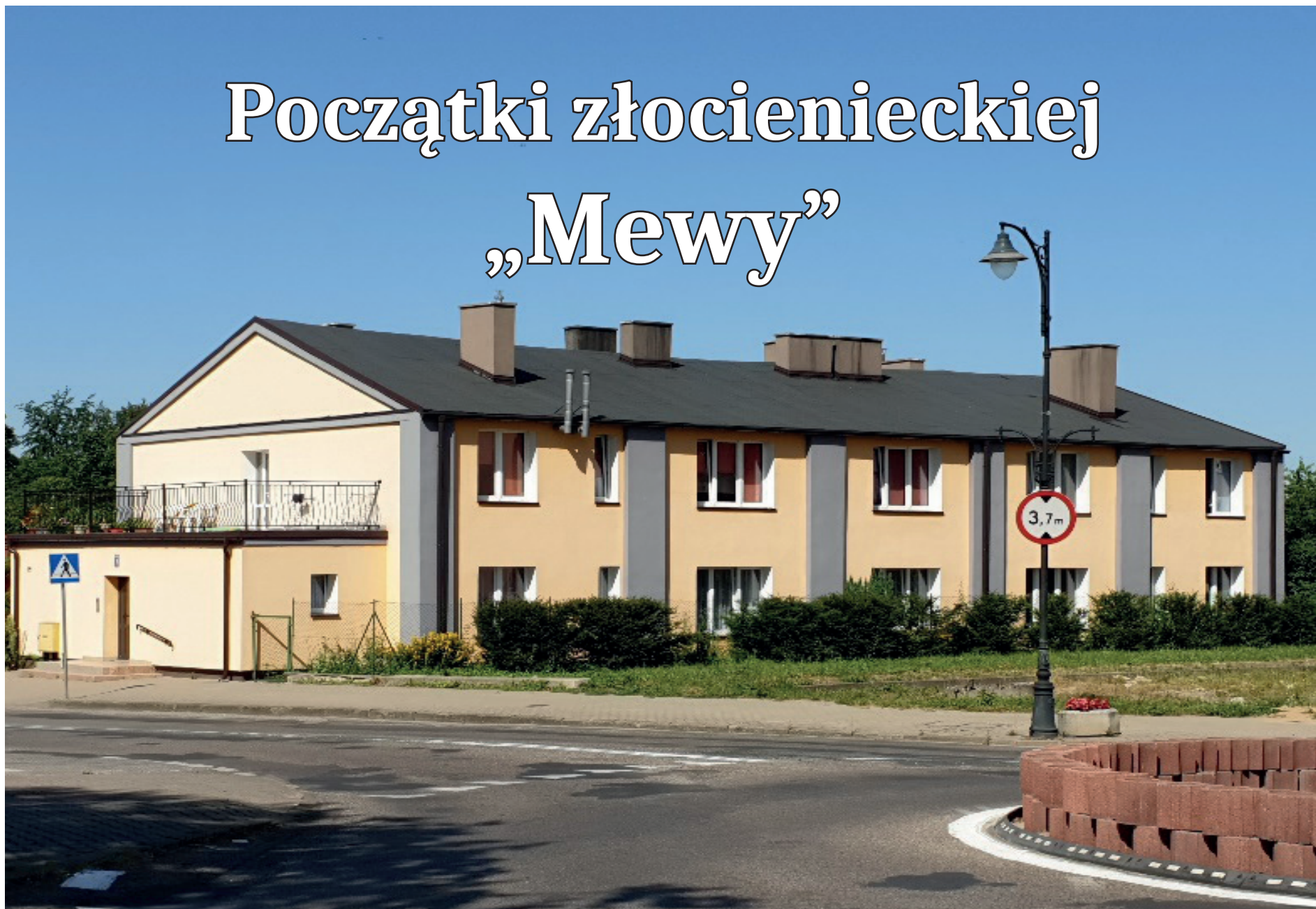
Budynek dawnego kina „Apollo”, dziś budynek mieszkalny