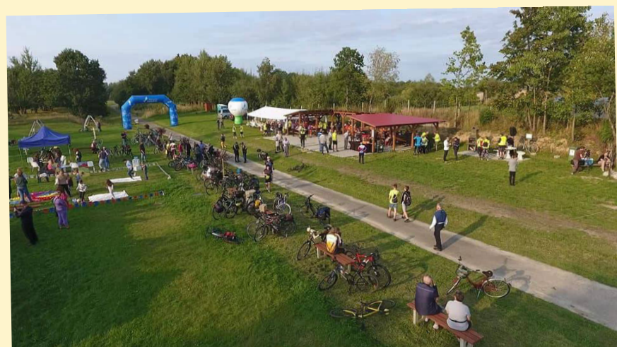
Otwarcie trasy rowerowej Białogard - Złocieniec