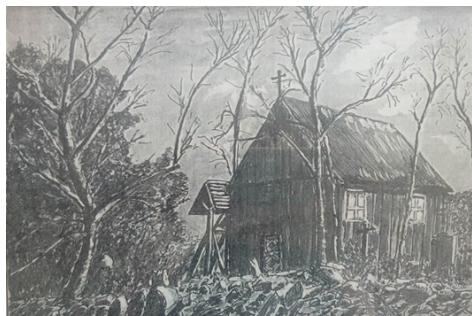
Rysunek kościoła w Toporzyku z okresu międzywojennego autorstwa Roberta Wolbe, na dziedzińcu widać jeszcze groby cmentarza przykościelnego