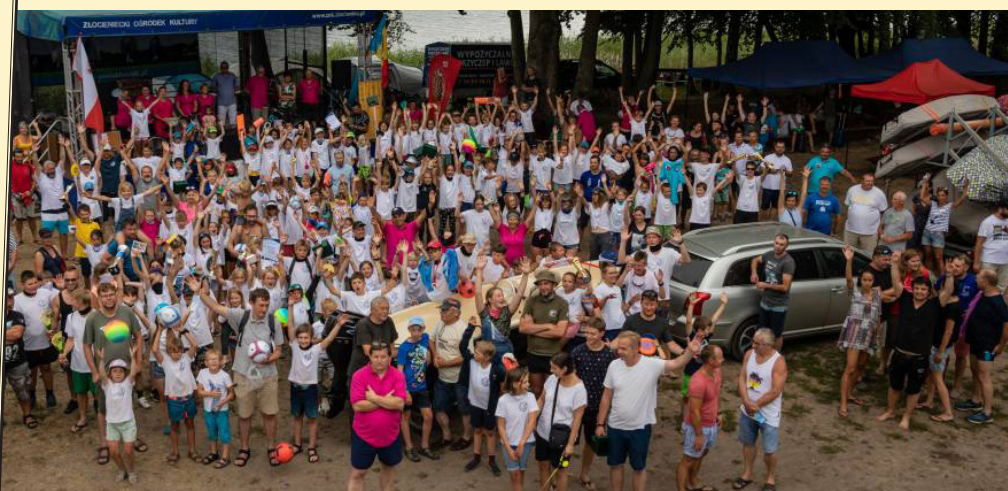
Regaty „Żagle 2020”