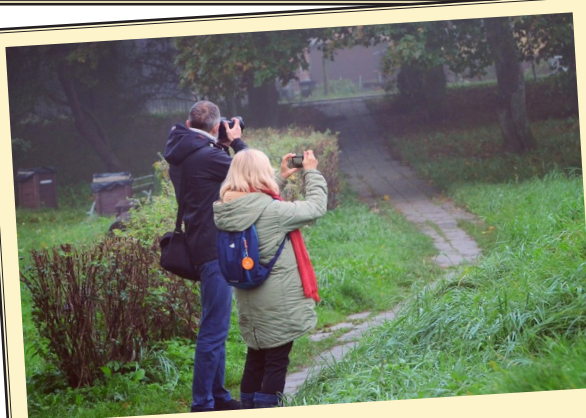
473 km... warsztaty fotograficzne