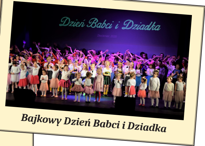
Bajkowy Dzień Babci i Dziadka