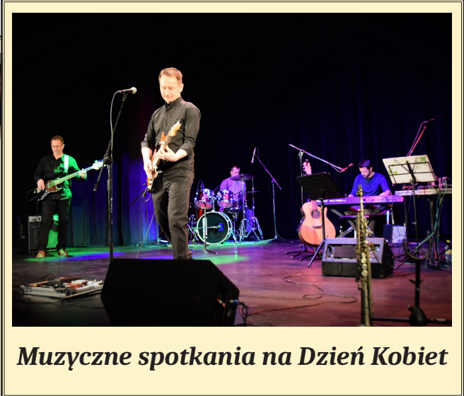
Muzyczne spotkania na Dzień Kobiet