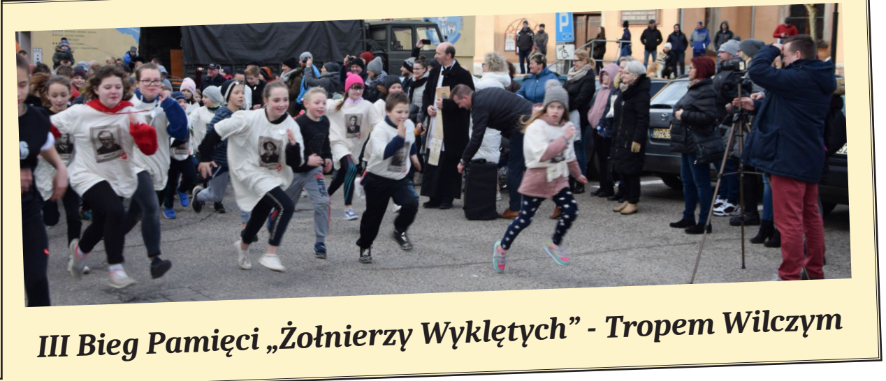
III Bieg Pamięci „Żołnierzy Wyklętych” - Tropem Wilczym