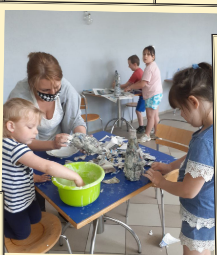
Wakacje w świetlicach