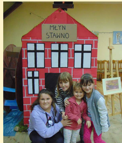
Bardzo Młoda Kultura