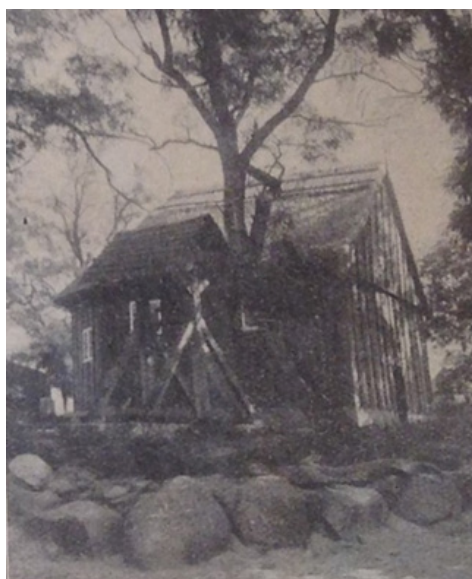
Kościół w 1929 r. po zakończeniu remontu; źródło: Münchner, Kirche in Langhof, w: Heimat-Kalender für den Kreis Deutsch Krone, Wałcz 1931, s. 52-53

Interesujący jest też opis chylącej się ku upadkowi świątyni przed renowacją. Münchner wskazywał, że kościół nie miał fundamentów, gdyż postawiono go jedynie na polnych kamieniach. Z tego powodu procesowi próchnienia poddały się dolne bale. Budowla była przez to bardzo przekrzywiona, co pod koniec XIX w. wręcz uniemożliwiało wchodzenie do środka przez drzwi. Przy wejściu zrobiono wtedy wykop, tak żeby pochylony człowiek mógł jednak dostać się do wnętrza świątyni. Już w 1910 r. zastanawiano się, w jaki sposób uratować tak rzadki i stary kościółek. Pieniądze na renowację znalazły się w okresie międzywojennym. Wyłożył je Kościół ewangelicki i państwo. Podniesiono wtedy całą konstrukcję o pół metra, żeby powróciła na swoje dawne miejsce. Dolne spróchniałe bale zastąpiono solidnym fundamentem.