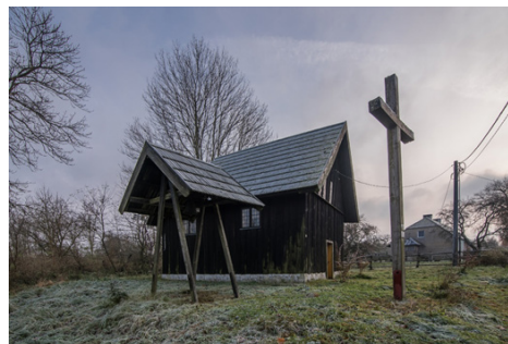
Szesnastowieczny drewniany kościół w Toporzyku, poddany renowacji w 1929 r. i zapewne po II wojnie światowej, kiedy wymieniono dach

Pastor Münchner opisał konstrukcję świątyni w następujący sposób: Odpowiednio do wielkości osady rozmiary Domu Bożego były dość skromne: 5,67 na 8,95 metra. Ale co niezwykle, był to tzw. kościół blokowy skonstruowany z osiemnastocentymetrowych bali położonych jeden na drugim, połączonych, wewnątrz szalowanych, a od zewnątrz ozdobionych nasadzanych na siebie deskami. Budynek bez wieży z prostym drewnianym krzyżem na kalenicy. Kryta trzcina dzwonnica stoi obok. Wyposażenie wewnętrzne było pozbawione ozdób, ołtarz z cegieł bez nastawy, małe okna oszkłone przy użyciu ołowiu. Brak organów 3 .