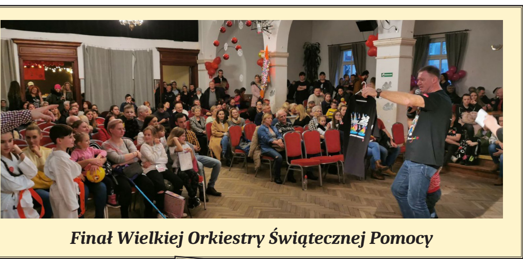
Finał Wielkiej Orkiestry Świątecznej Pomocy