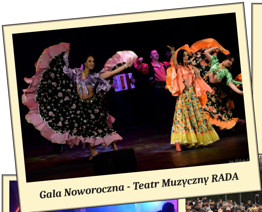
Gala Noworoczna - Teatr Muzyczny RADA