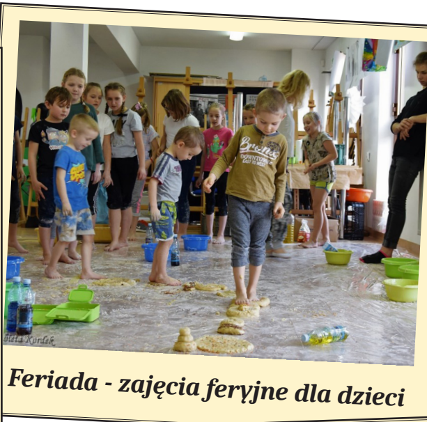
Feriada - zajęcia feryjne dla dzieci