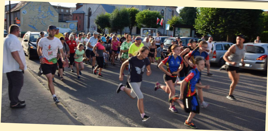
Bieg Okolicznościowy z okazji 100 rocznicy urodzin Świętego Jana Pawła II