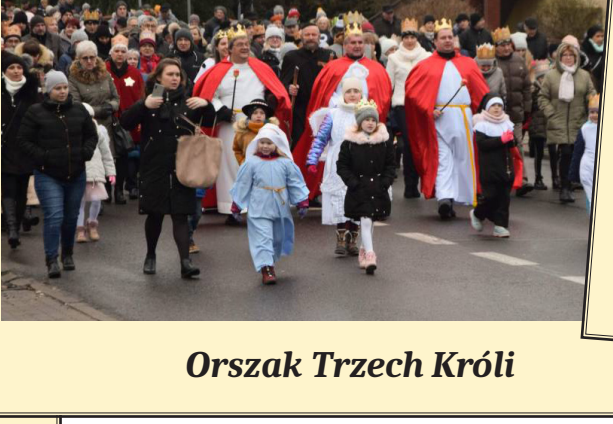
Orszak Trzech Króli