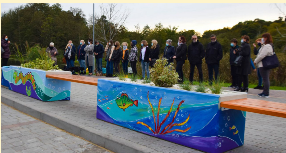
Warsztat malarski „Kolorowe Donice nad Drawą”