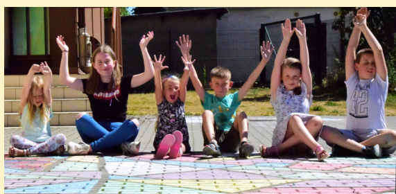
ARTystyczne podwórko Złocienieckiego Ośrodka Kultury