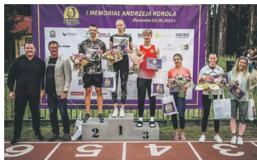
I Memoriał Andrzeja Korola str. 12-13