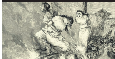
Głośny proces o czary str. 15