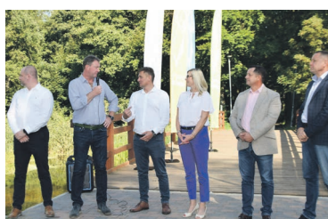
Rowerem ze Złocienca do Wałcza str. 5