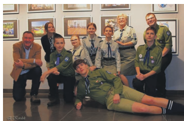
Nadszedł czas na podsumowanie... str. 18