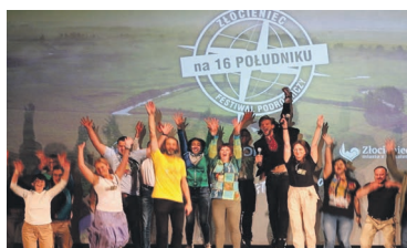
Złocieniec na 16 południku - festiwal podróżniczy str. 21