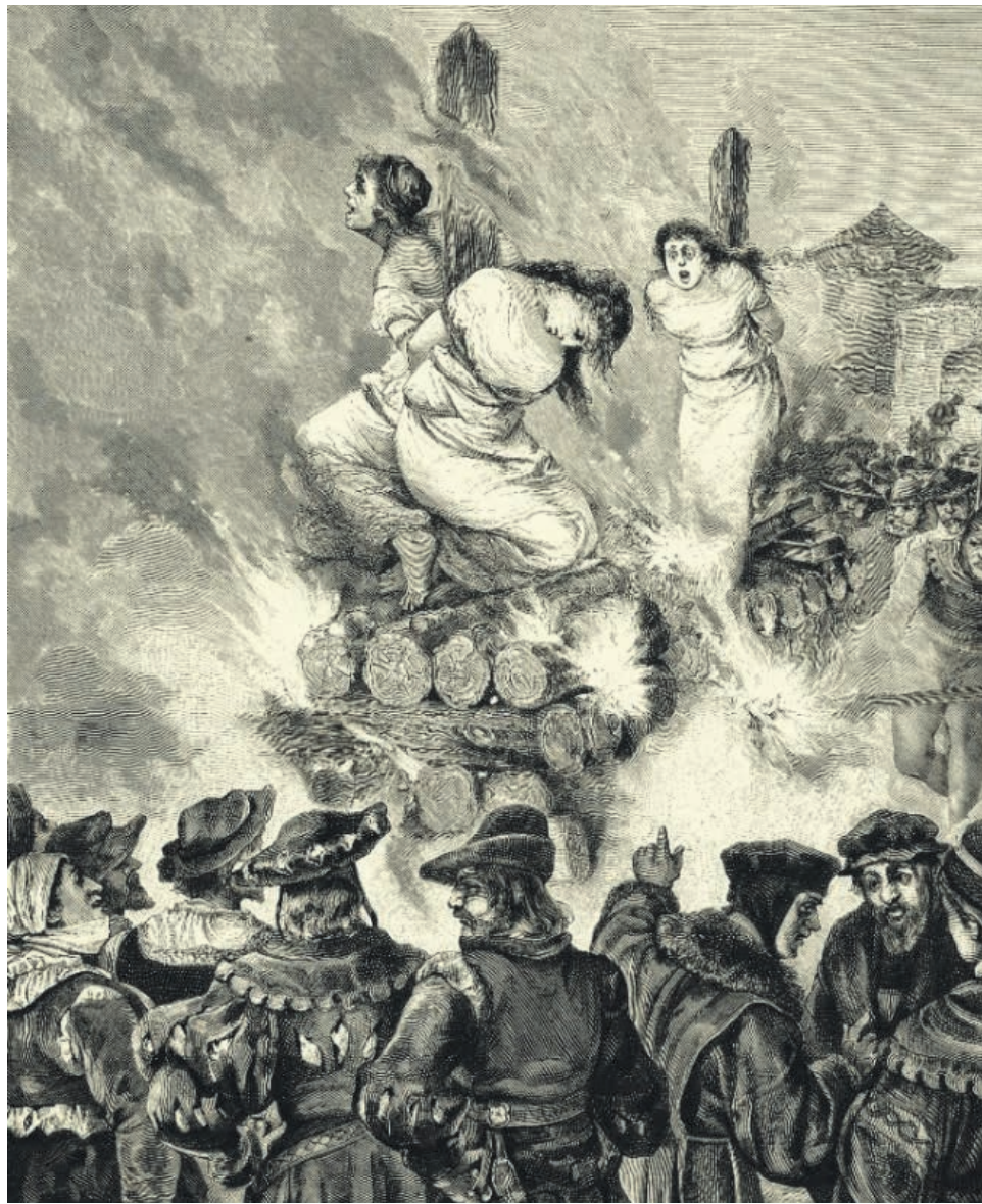
Palenie kobiet oskarżonych o czary według dziewiętnastowiecznego sztychu