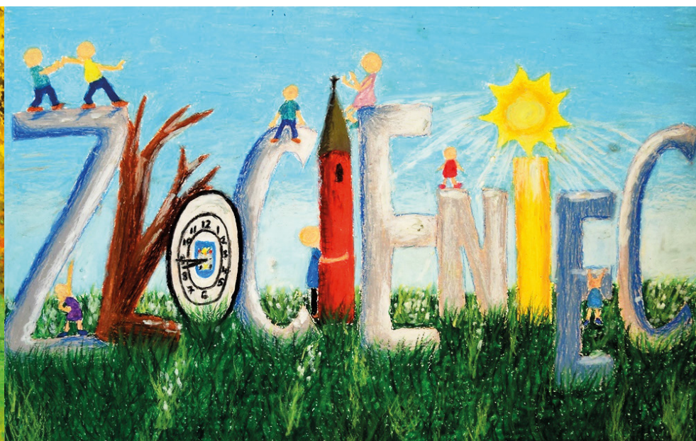
15_kat 13-15 lat III miejsce Zuzanna Lichwa