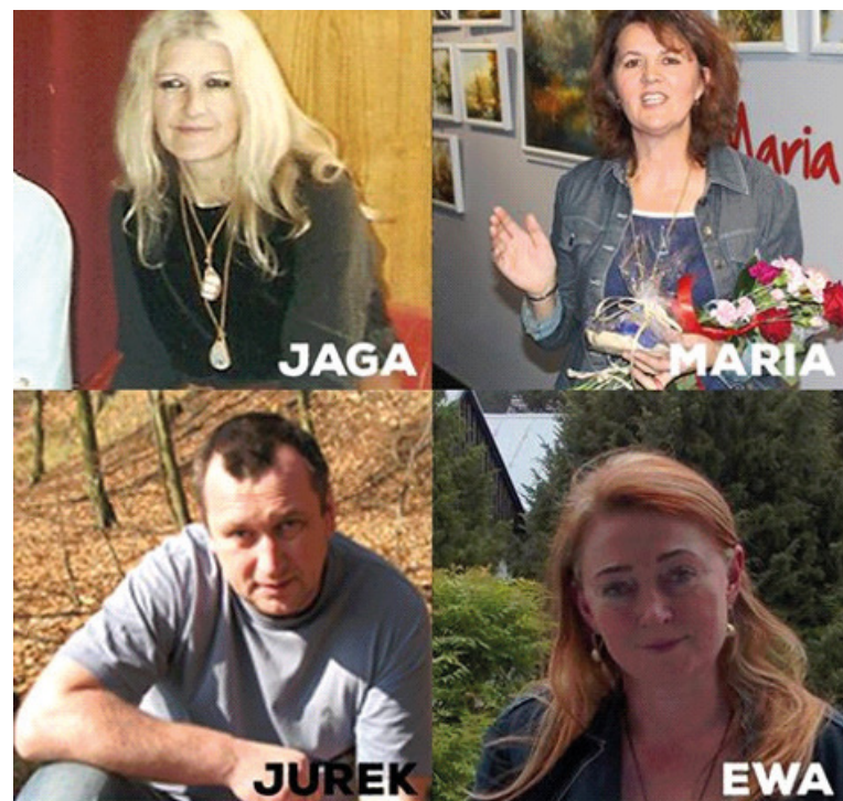
Członkowie Grupy art4art. Grupa zamknięta.