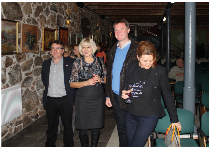
Burmistrz Złocieńca z członkami grupy