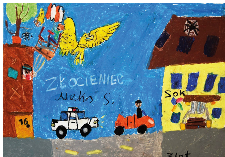
3_kat. 6-9 lat III miejsce Aleks Sawicki