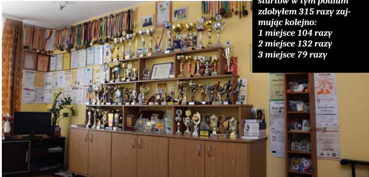
Kolekcja zdobytych medali i pucharów