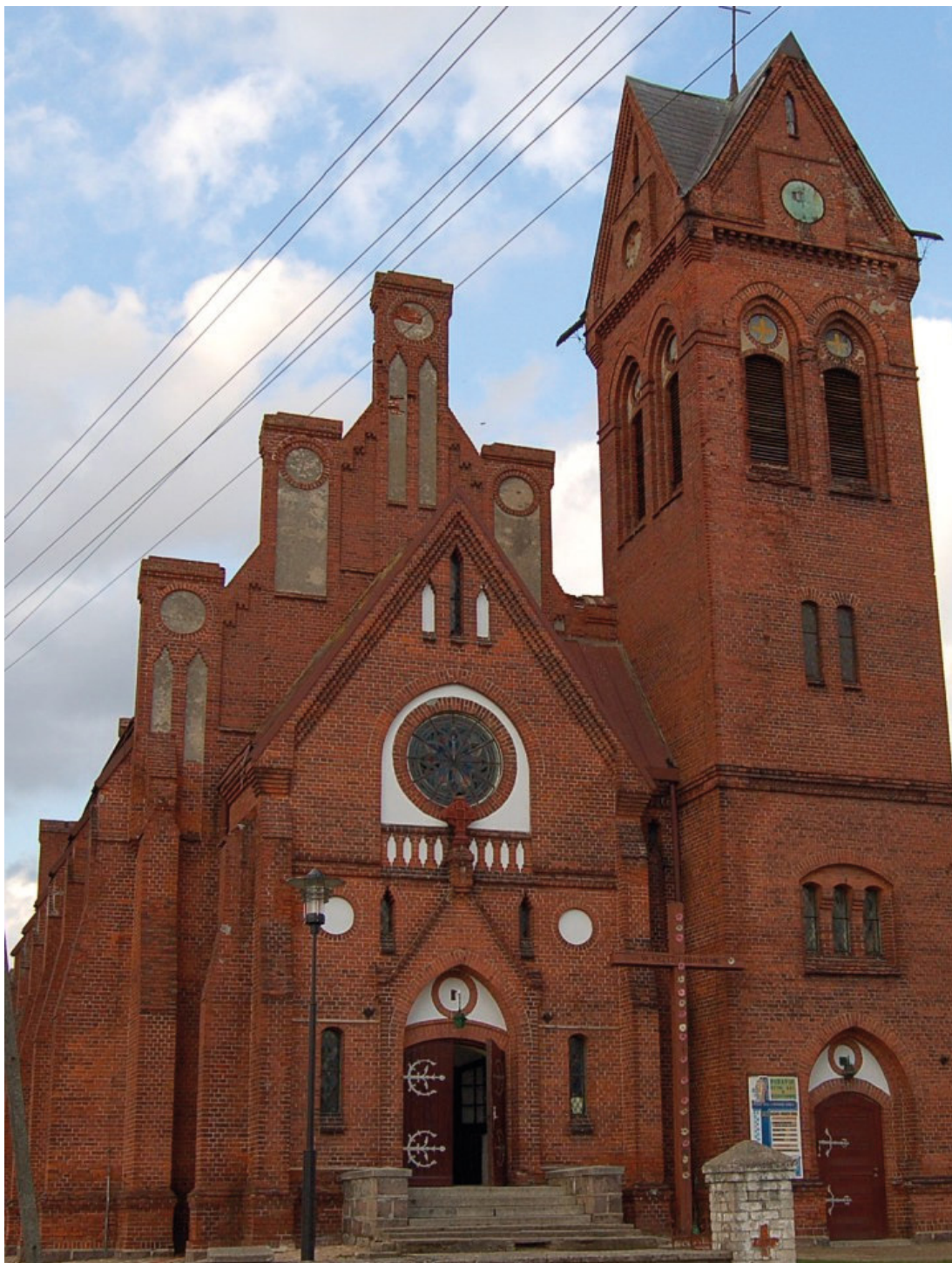
Kościół w Wierzchowie - stan obecny.