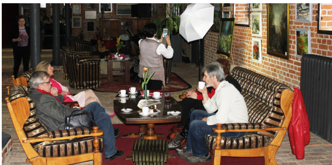
W ramach realizacji projektu, Grupa art4art utworzyła Galerię Malarstwa „Folwark art4art”