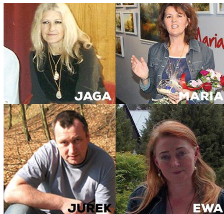
Członkowie Grupy art4art. Grupa zamknięta.