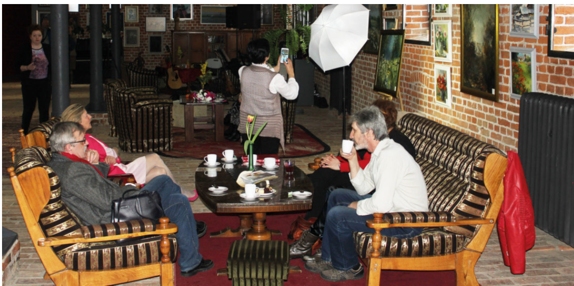
W ramach realizacji projektu, Grupa art4art utworzyła Galerię Malarstwa „Folwark art4art”