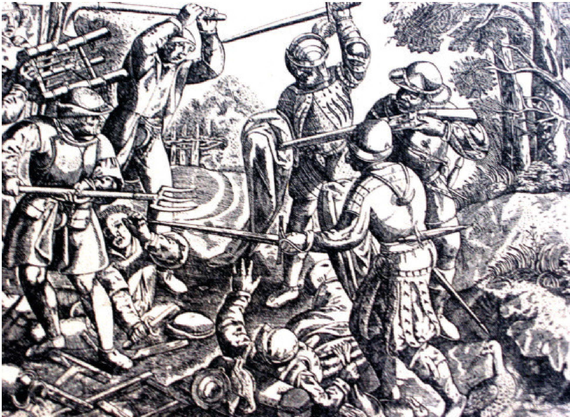
Chłopi stawiają opór bandzie zdemoralizowanych żołdaków